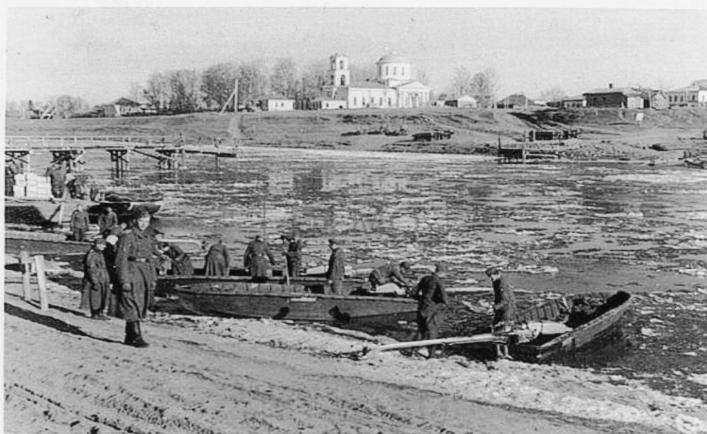
Мост через Волгу и за ним Успенский собор в Зубцове Тверской области