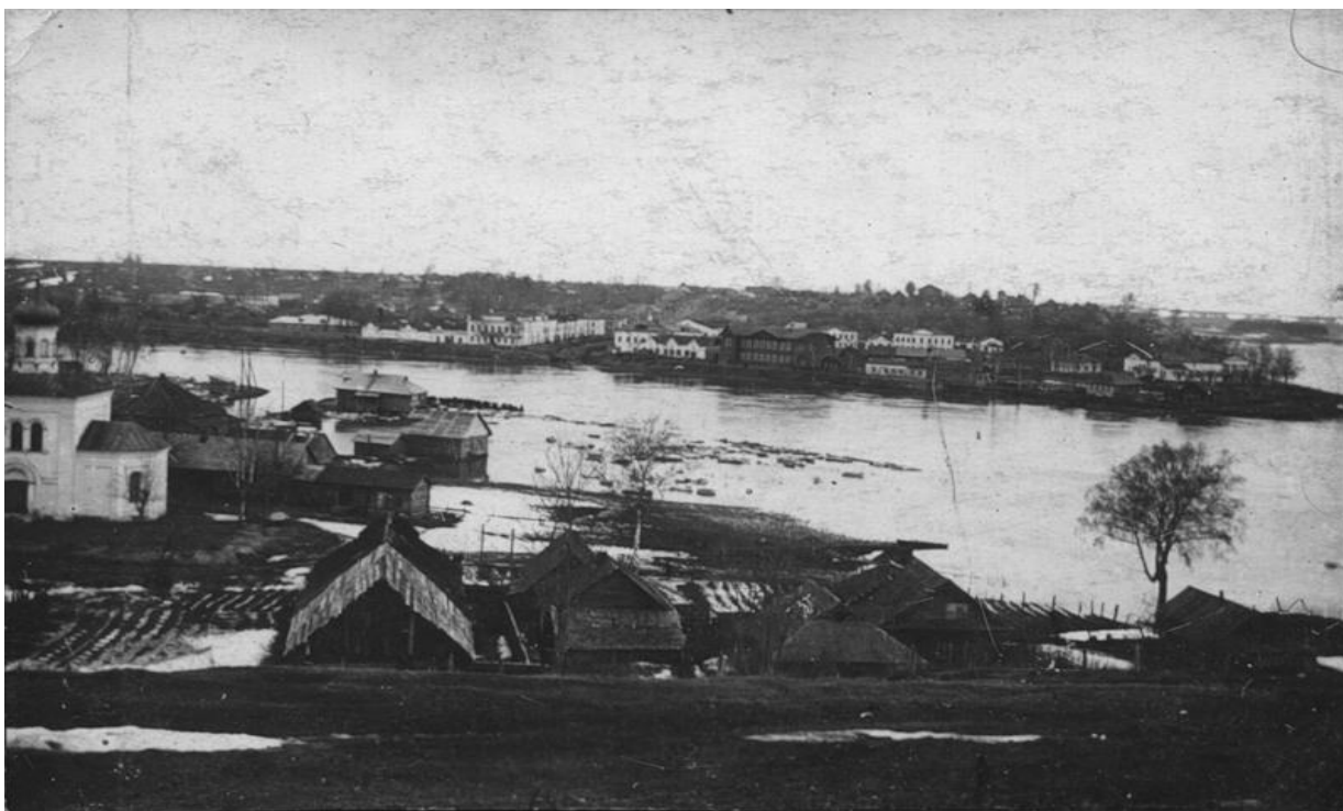
фотографии разлива Волги и Вазузы 1906 года.