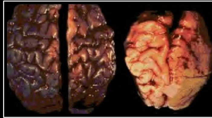
Алкоголь и Мозг