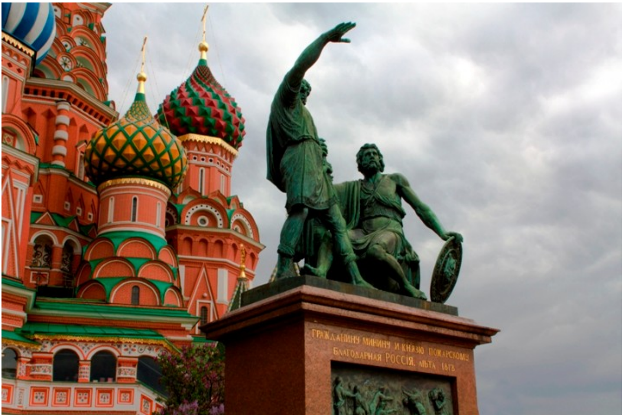
Памятник Минину и Пожарскому в Москве.