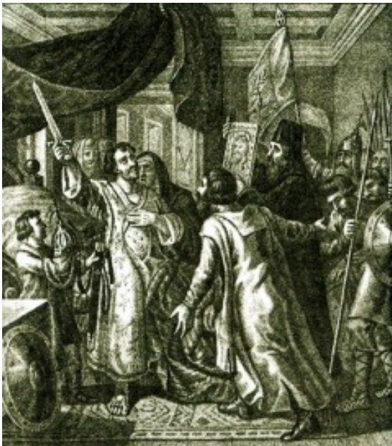
Чориков Б. А. Призыв Минина к Пожарскому